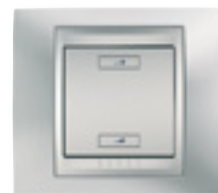
vypínače a stmívače ve špičkovém designu